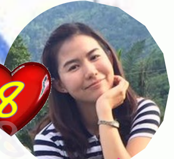
โรจนาrien จงษ์จนิทา